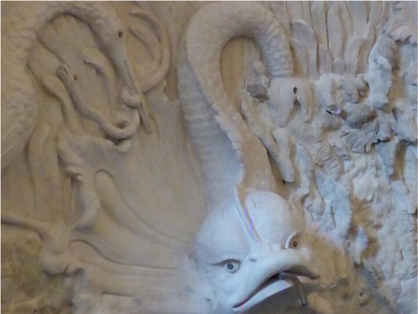
Visite guidée Saint-Antoine au fil du temps - Le temps du renouveau : art et collections 38160 Saint-Antoine-l'Abbaye

Visite permettant de découvrir des espaces qui ne sont pas ouverts au public.